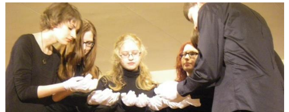
„M. K. Čiurlionis: grįžtantys į drobę garsai“ (2010-2011)