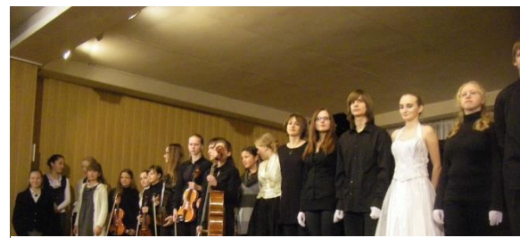
„M. K. Čiurlionis: grįžtantys į drobę garsai“ (2010-2011)