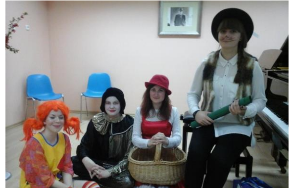
„Muzikinė pasaka“ (2014-2015)