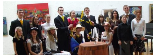
„Oginskio polonezai sename dvare“ (2007-2008)