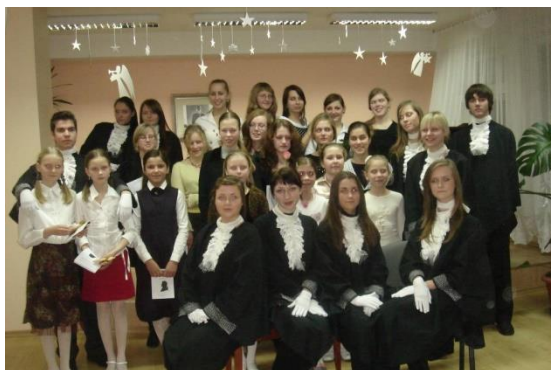
„Mano Mocartas“ (2009-2010)

gimnazijos žavisi muzika. Spektaklio-koncerto metu tarp dalyvių visada atsiranda ypatingas ryšys, tarsi jie vieni kitus papildo. Ir tai stebėti yra didelis malonumas!