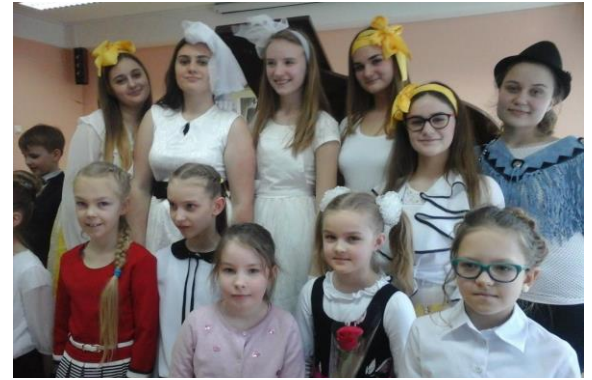
„Muzikinė pasaka“ (2016-2017)